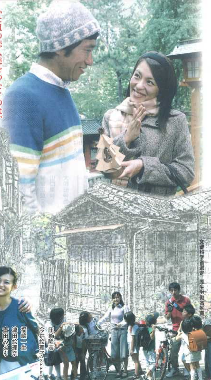
文部科学省選定 厚生労働省推薦

ふた組の恋人達をつなぐのは、 一本の手づくり映画に秘められた愛と哀しみの奇跡!!